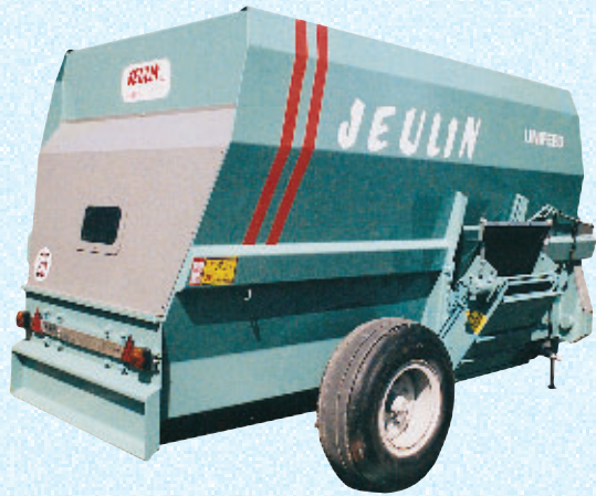
MELANGEUSE BOOMERANG 120/2